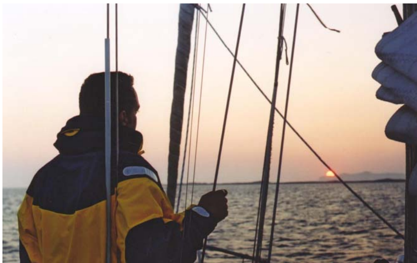
stage avancé, été 2004

Pour mieux connaître le contenu d'apprentissage des brevets disponibles, consultez le site web de la Fédération de voile du Québec à www.voile.qc.ca . De plus, si vous désirez suivre le processus d'accréditation, nous vous suggérons fortement de faire l'acquisition du livre Initiation à la croisière que vous pouvez vous procurer en contactant la Fédération de voile du Québec. Le coût du livre est de 23.00$.