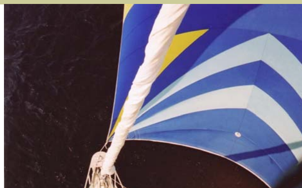
stage avancé, 2004

Vous aurez pendant la prochaine saison de voile l'occasion de nous faire parvenir un de vos souvenirs.